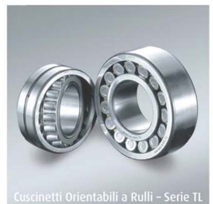
Cuscinetti Orientabili a Rulli - Serie TL

Per maggiori informazioni su NSK, visitate il sito www.nsk.europa.it