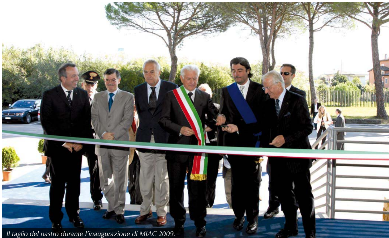
Il taglio del nastro durante l'inaugurazione di MIAC 2009.

dei macchinari e delle attrezzature per cartiere.